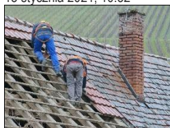
Wypadek przy wymianie dachu

W trakcie prac dekarских ranny został 28-letni pracownik. Niestety, jego życia nie udało się 13 stycznia 2021, 10:32